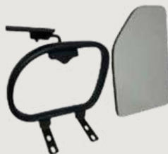
GRUPO 03 – ITEM 17 Kit Braço com Prancheta Escamoteável