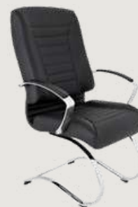
GRUPO 03 – ITEM 09 Poltrona Presidente Fixa