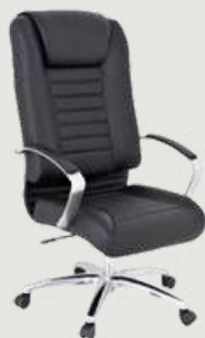
GRUPO 03 – ITEM 08 Poltrona Presidente Giratória