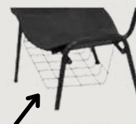
GRUPO 03 – ITEM 18 Porta Objetos Sob Cadeiras