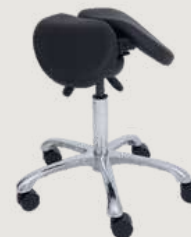
GRUPO 03 – ITEM 12 Cadeira Mocho com Assento Sela Com Regulagem de Abertura