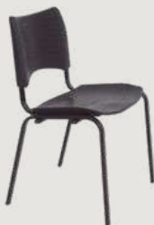
GRUPO 03 – ITEM 10 Cadeira Fixa em Polipropileno