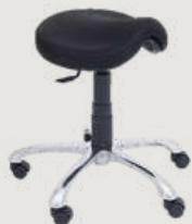
GRUPO 03 – ITEM 13 Cadeira Mocho com Assento Sela Monobloco