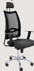
GRUPO 03 – ITEM 15 Cadeira Giratória Encosto Alto Revestidos por Malha Respirável