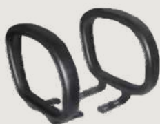
GRUPO 03 – ITEM 16 Braços Fixos (Par)