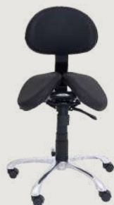
GRUPO 03 – ITEM 14 Cadeira Mocho com Assento Sela e com Encosto