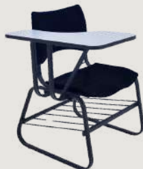
GRUPO 03 – ITEM 11 Cadeira Universitária em Polipropileno