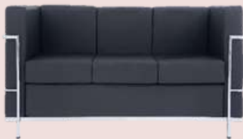
GRUPO 02 – ITEM 10 Poltrona de Espera 3 Lugares