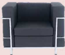
GRUPO 02 – ITEM 08 Poltrona de Espera 1 Lugar