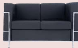
GRUPO 02 – ITEM 09 Poltrona de Espera 2 Lugares