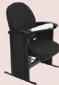
GRUPO 02 – ITEM 12 Poltrona Auditório