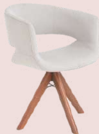
GRUPO 02 – ITEM 11 Poltrona Baixa