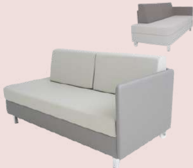
GRUPO 02 – ITEM 07 Sofá Cama