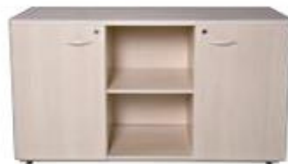
ITEM – 27 ARMÁRIO DIRETORIA COM NICHO CENTRAL 800 x 450 x 1800mm QUANTIDADE: 20 VALOR: R$3.100,00