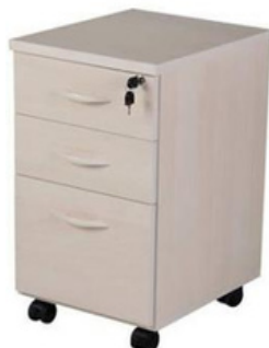
ITEM – 26 GAVETEIRO VOLANTE DUAS GAVETAS + UM GAVETÃO 400 x 460 x 540mm QUANTIDADE: 100 VALOR: R$900,00