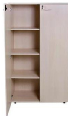
ITEM – 21 ARMÁRIO ALTO DUAS PORTAS 800 x 450 x 1600mm QUANTIDADE: 50 VALOR: R$1.800,00