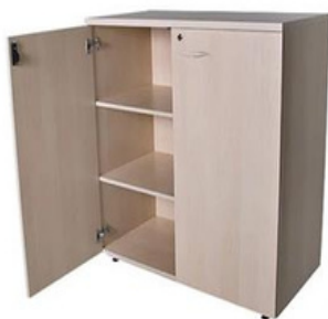
ITEM – 20 ARMÁRIO MÉDIO DUAS PORTAS 800 x 450 x 1100mm QUANTIDADE: 30 VALOR: R$1.450,00