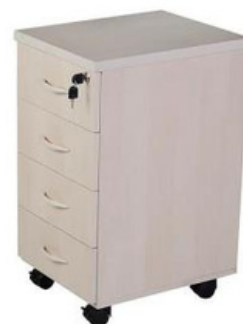
ITEM – 29 GAVETEIRO VOLANTE 4 GAVETAS 400 x 460 x 540mm QUANTIDADE: 20 VALOR: R$1.000,00

** Disponibilizamos sob consulta toda documentação necessária (ata assinada, publicações, modelo de ofício de adesão ETC)