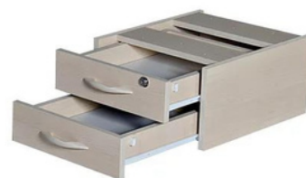
ITEM – 24 GAVETEIRO FIXO 2 GAVETAS 460 x 400 x 280mm QUANTIDADE: 100 VALOR: R$420,00