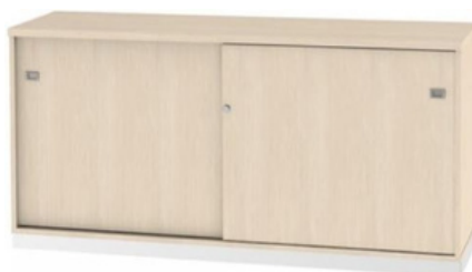
ITEM – 29 ARMÁRIO DIRETORIA COM PORTAS DE CORRER 800 x 450 x 740mm QUANTIDADE: 08 VALOR: R$3.300,00