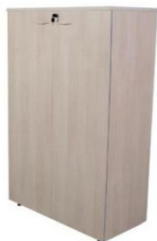
ITEM – 22 ARMÁRIO EXTRA ALTO DUAS PORTAS 800 x 450 x 2100mm QUANTIDADE: 50 VALOR: R$2.100,00