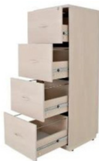
ITEM – 23 ARMÁRIO ARQUIVO 4 GAVETAS 400 x 460 x 1300mm. QUANTIDADE: 10 VALOR: R$1.800,00