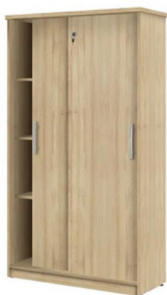
ITEM – 28 ARMÁRIO DIRETORIA COM PORTAS DE CORRER 1600 x 450 x 1800mm QUANTIDADE: 04 VALOR: R$5.800,00