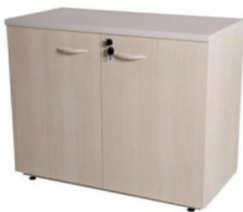
ITEM – 19 ARMÁRIO BAIXO DUAS PORTAS 800 x 450 x 740mm QUANTIDADE: 30 VALOR: R$1.200,00

maria@layout.ind.br Fone(s) : (54) 98151-5008 (54) 3224-6808