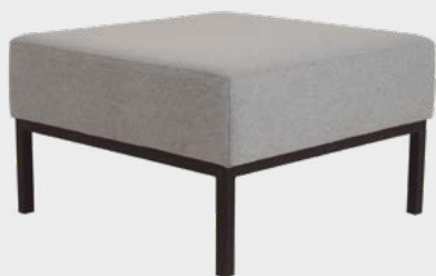
Sofá Roma Modular sem Encosto

O Sofá Roma Modular contempla a linha de produtos que proporcionam sofisticação e design para moldar os ambientes dinâmicos e inovadores. Permita-se criar!