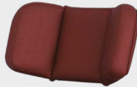
Apoio de Cabeça com Regulagem