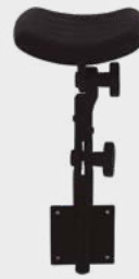
Braço de Sorologia com Regulagem