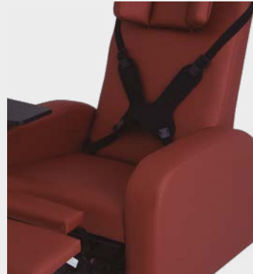
Cinto 4 Pontas