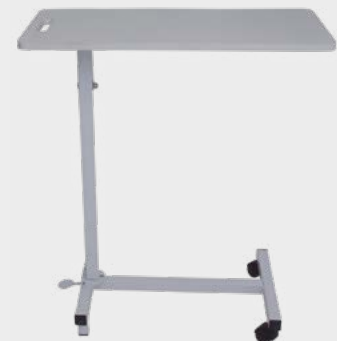
Mesa de Alimentação com Regulagem de Altura a Gás