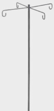
Suporte para Soro