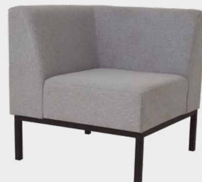
Sofá Roma Modular Encosto Duplo