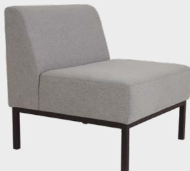
Sofá Roma Modular Encosto Simples